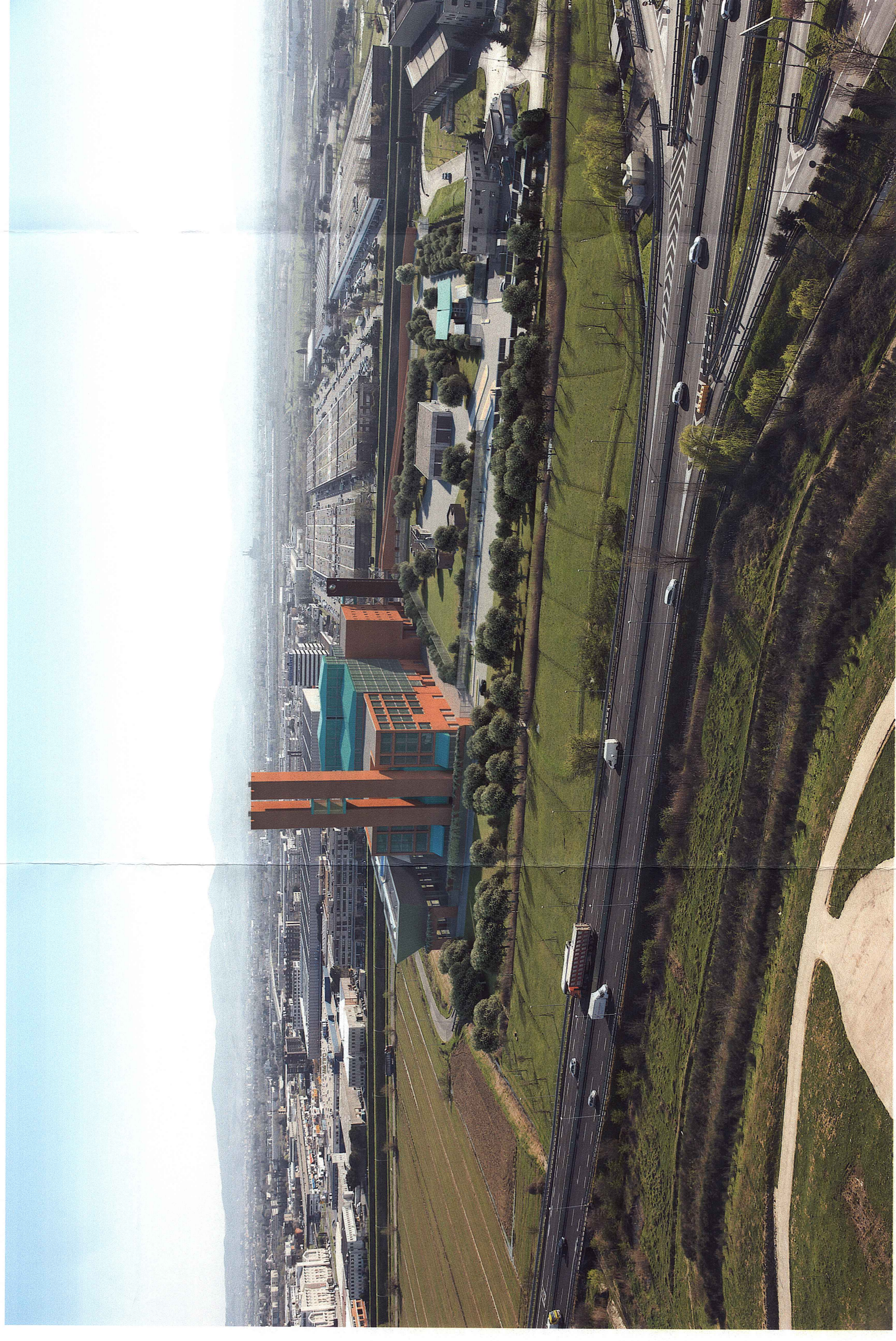
Vista da Nord - dall'autostrada