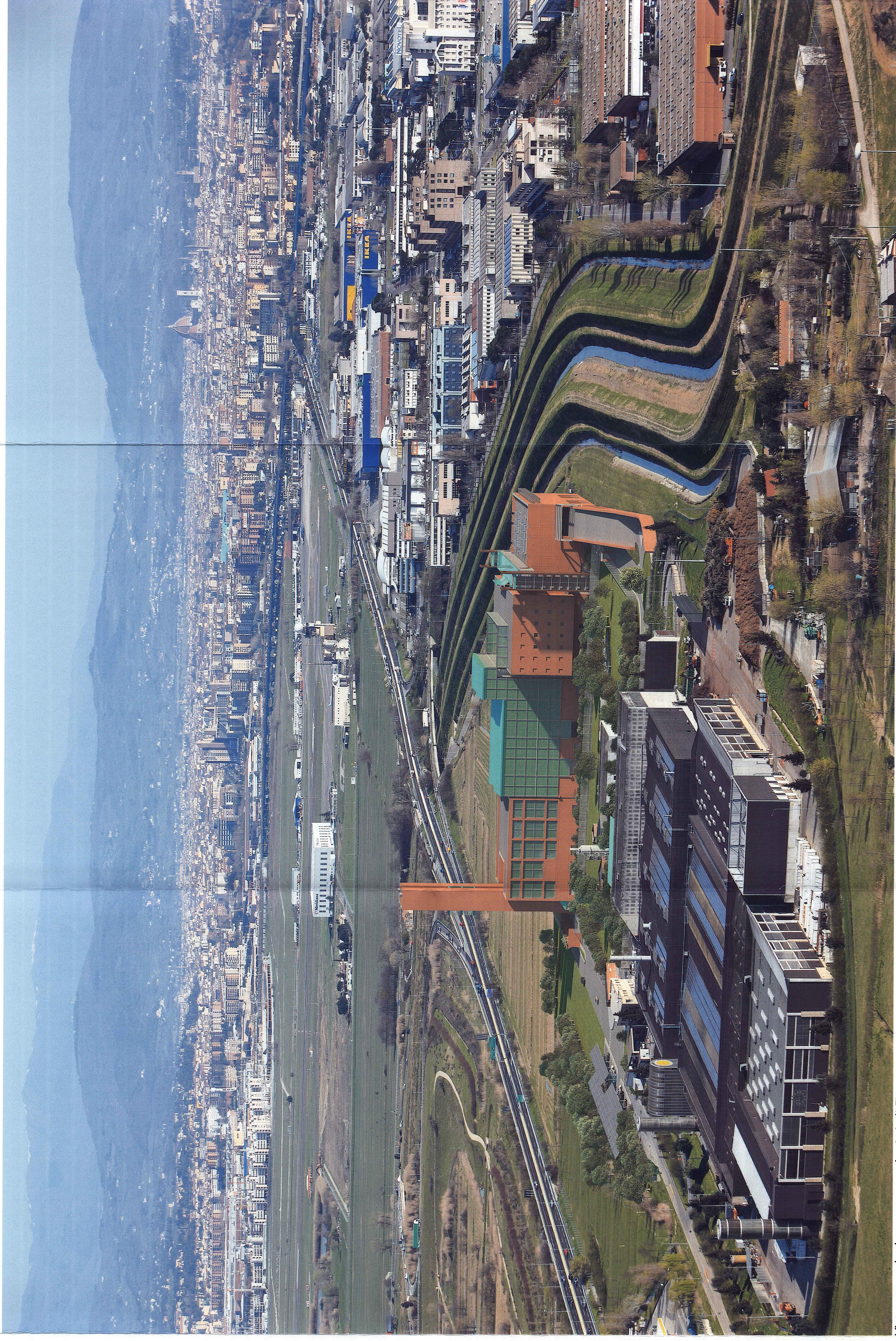
Vista generale da ovest verso la città di Firenze