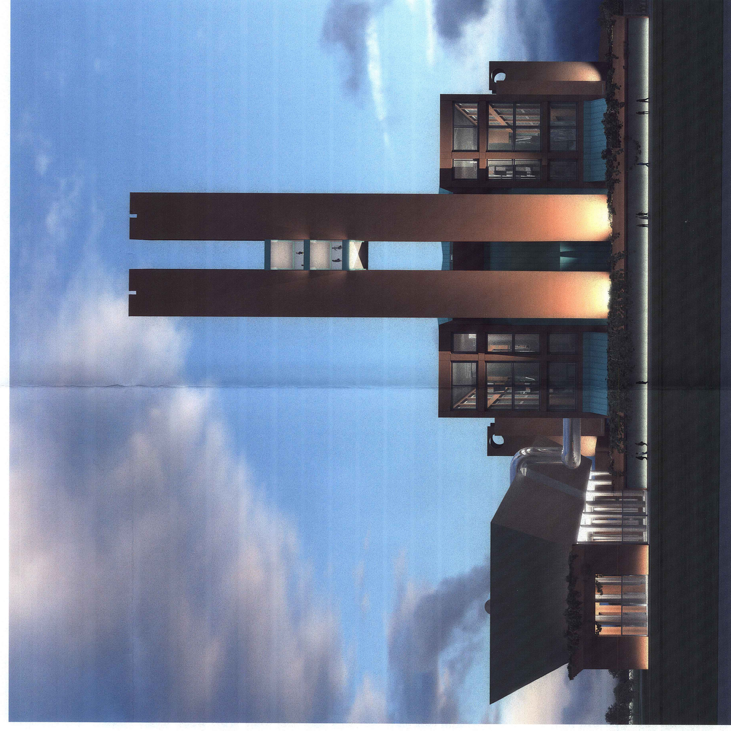
Vista notturna del fronte Nord