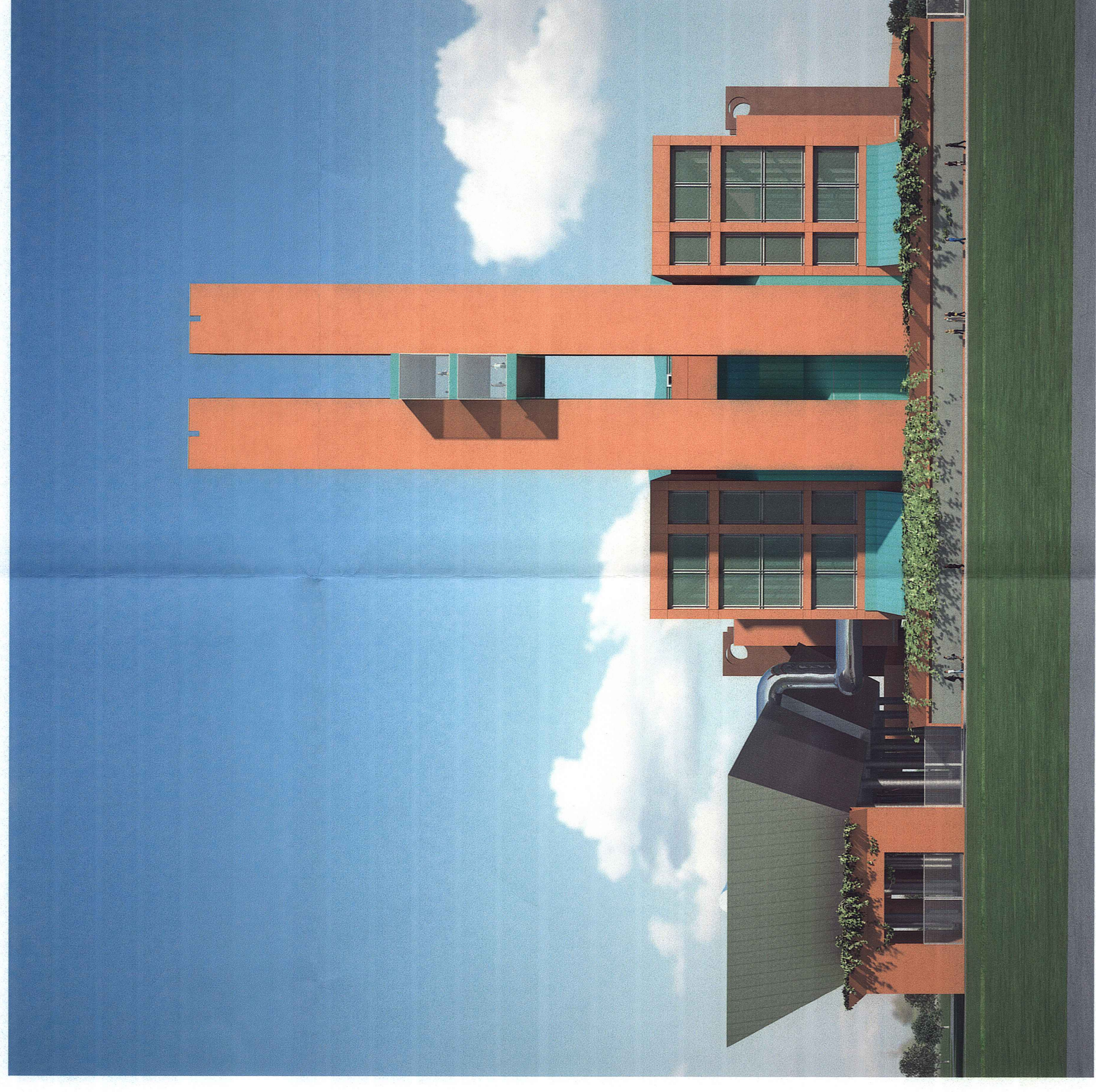
Vista diurna del fronte Nord