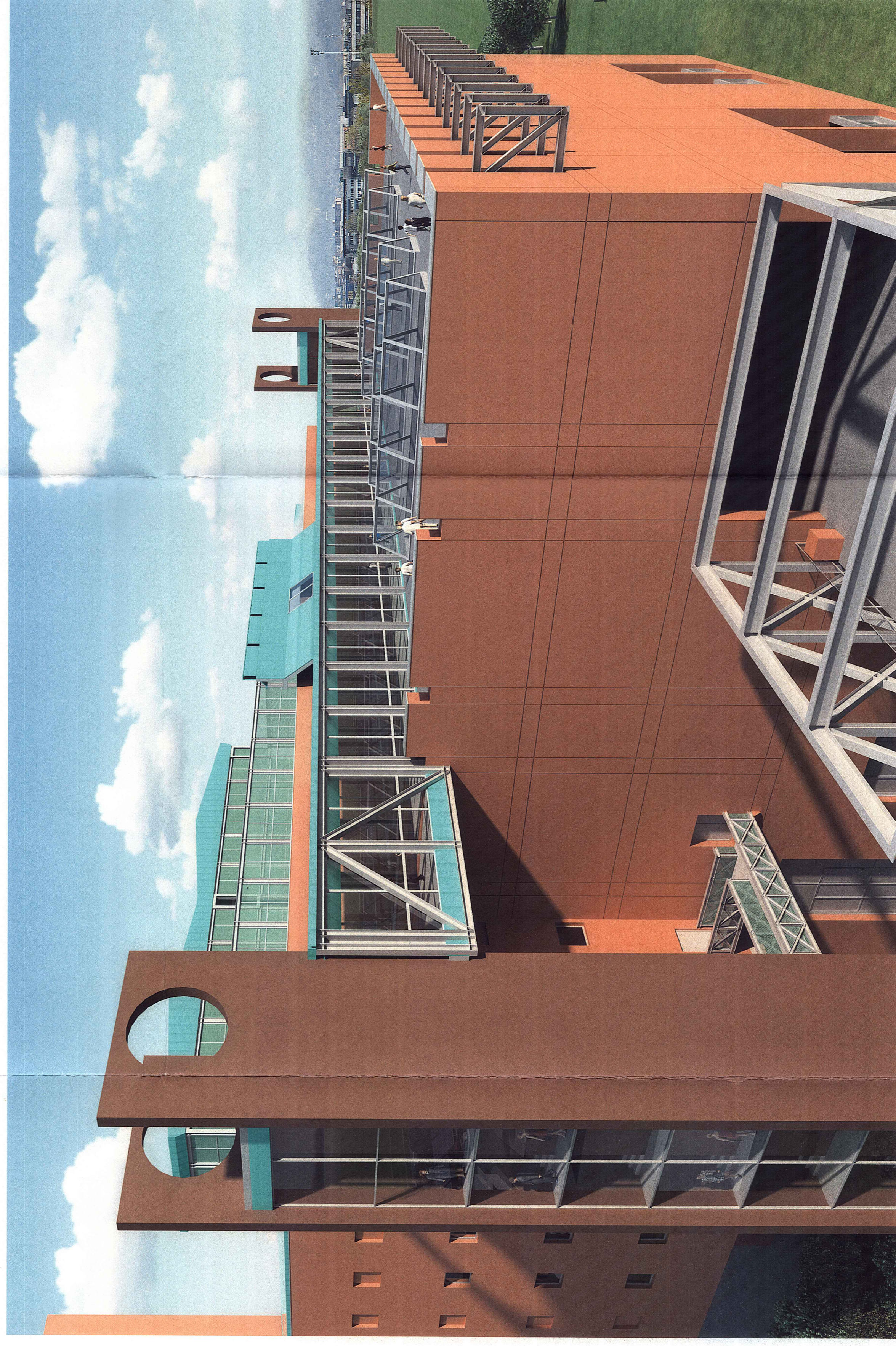
Vista dell'avanzassa con il corpo uffici