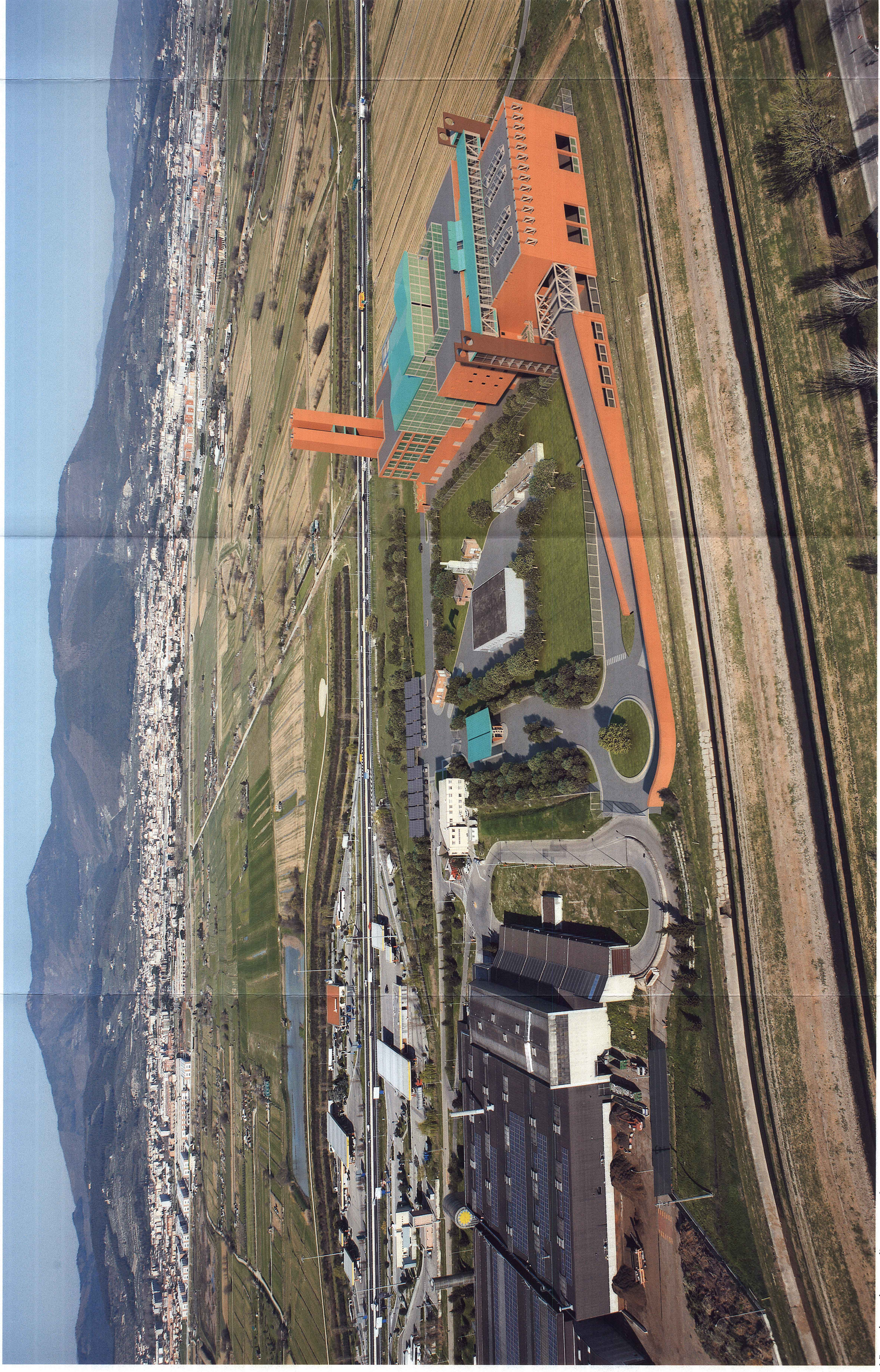
Vista da sud verso l'autostrada